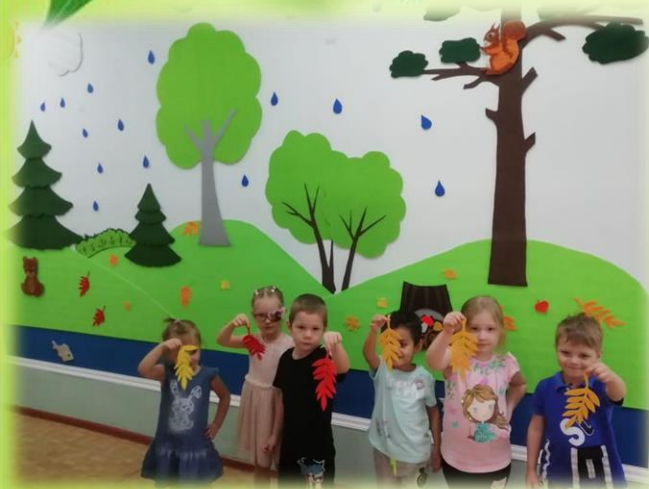
«Какой он, листик»