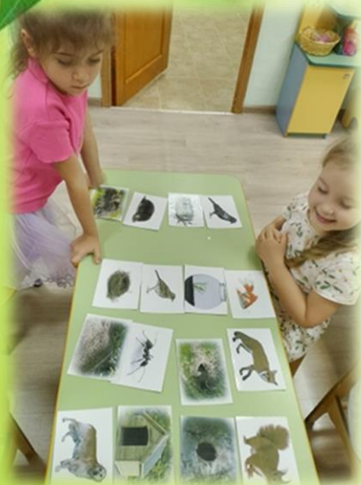
«Кто где живет?»