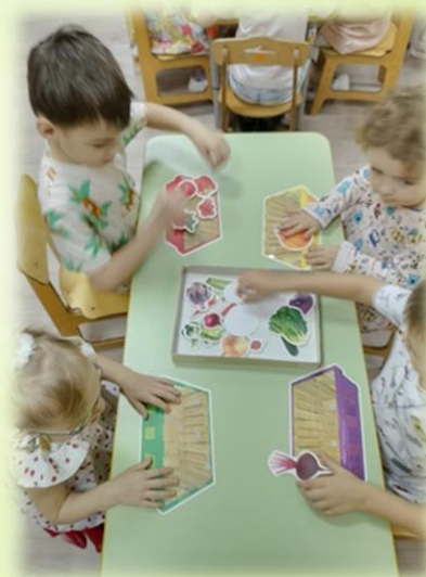
«Во саду ли, в огороде»