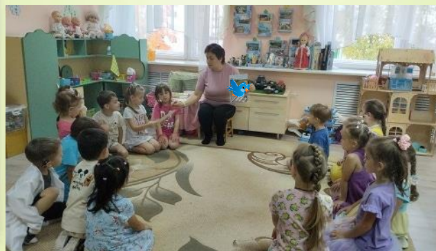
«В воде, воздухе, на земле»