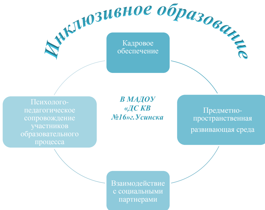
Рис.2 Модель инклюзивного образования