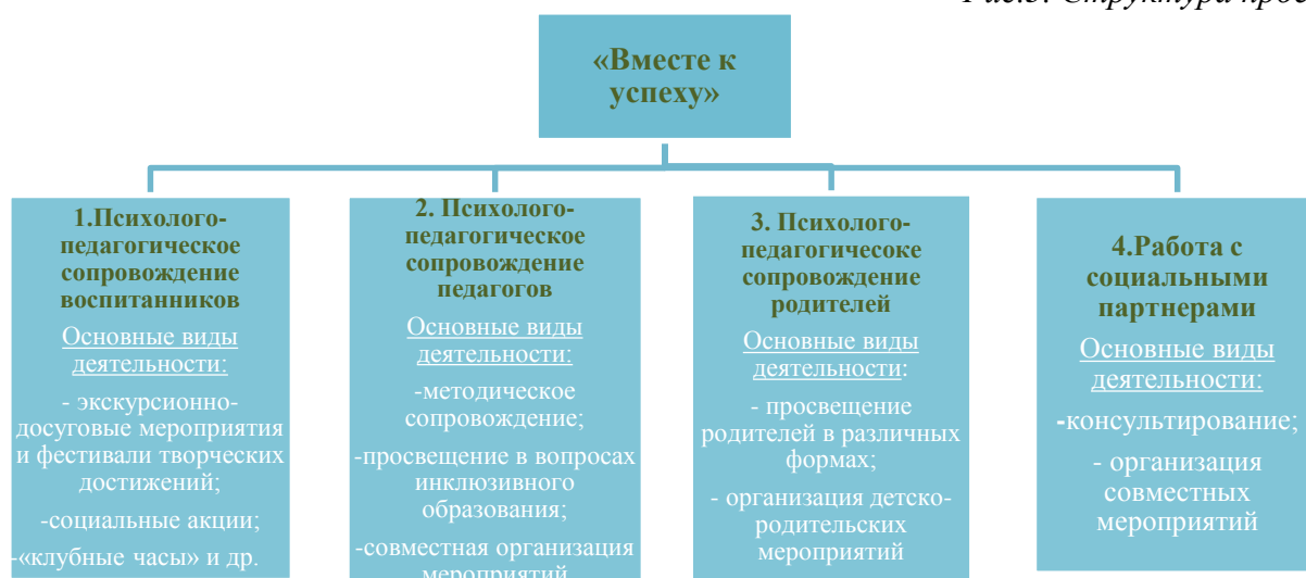
Рис.3. Структура проекта

В проекте выделено 4 направления, позволяющие охватить всех участников образовательных отношений: