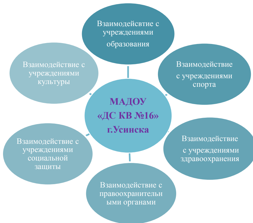
Рис.1. Схема межведомственного взаимодействия и социального партнерства в рамках проекта